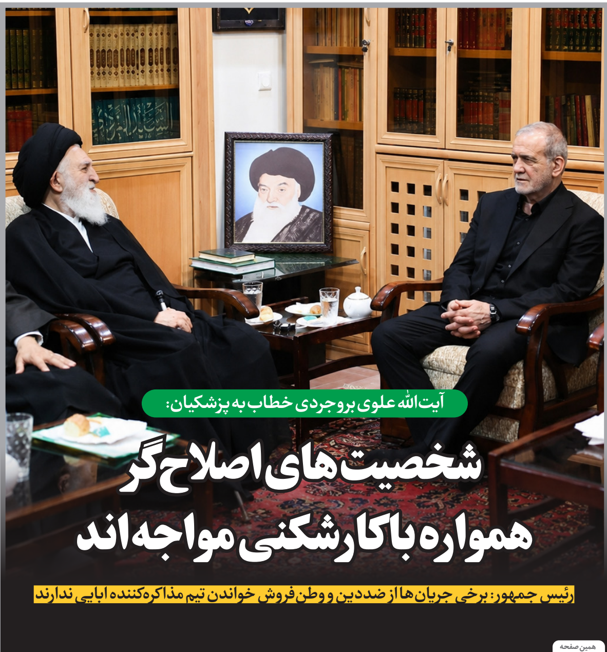
آیت الله علوی بروجردی خطاب به پزشکيان: